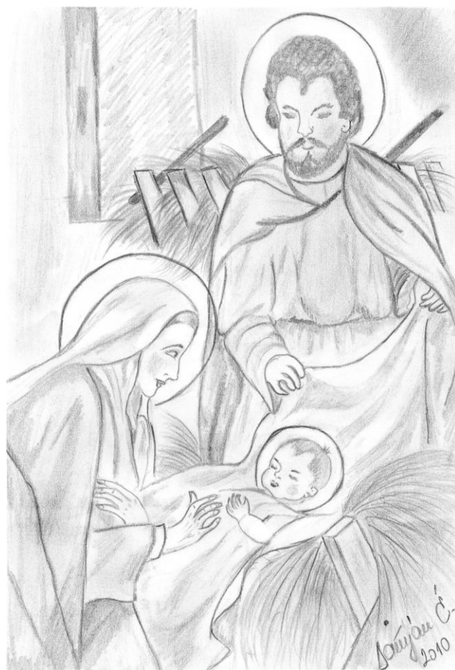
Rajzolta: Damján Éva, 2010