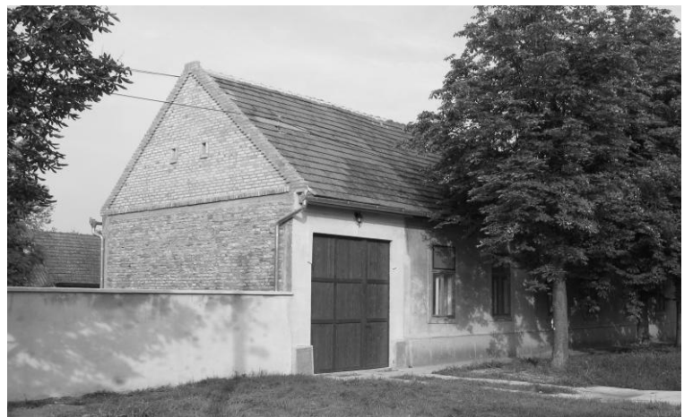
A bejárat a garázzsal egykor és napjainkban