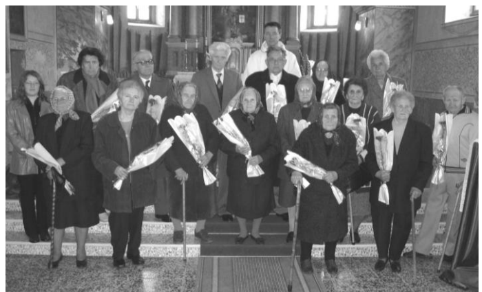
...és nyolcvan fölöttiek az oltár előtt