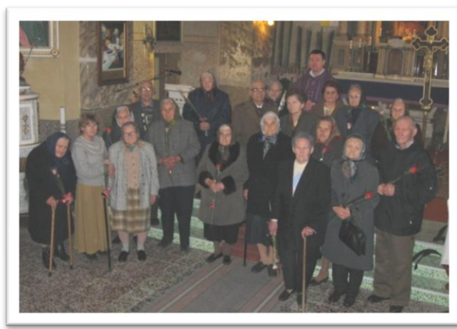
...és nyolcvan fölöttiek az oltár előtt