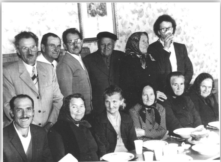
Egy munkaakció utáni megvendégelés (1989.X.29.)