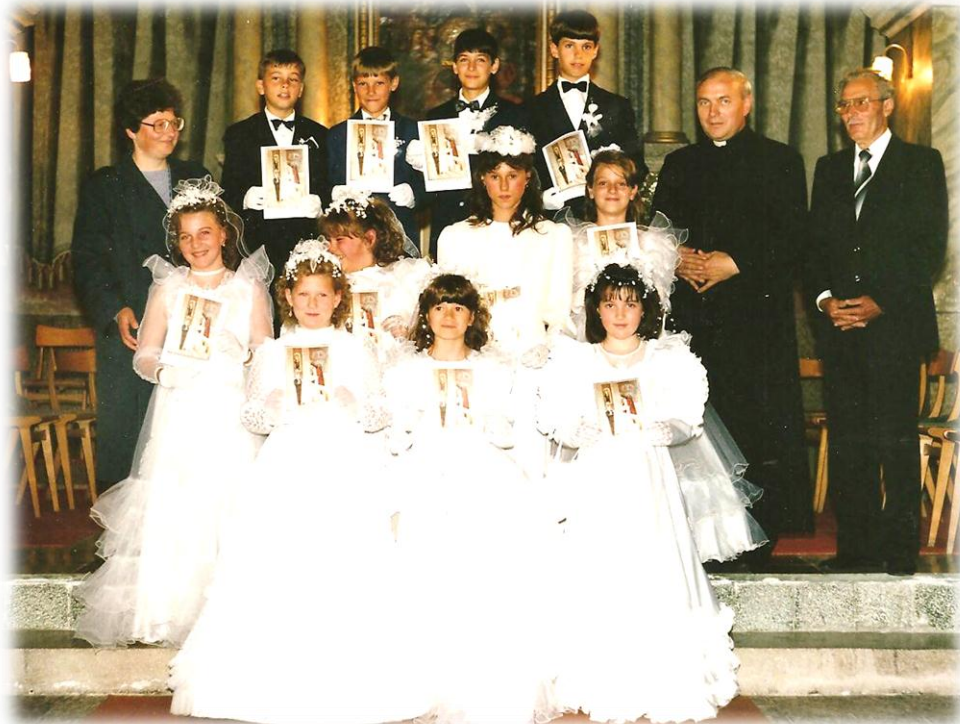
Elsőáldozók 20 évvel ezelőtt (1994.06.12.)